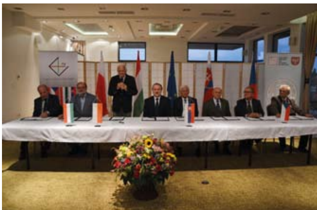
Przewodniczący delegacji przed podpisaniem protokołu końcowego