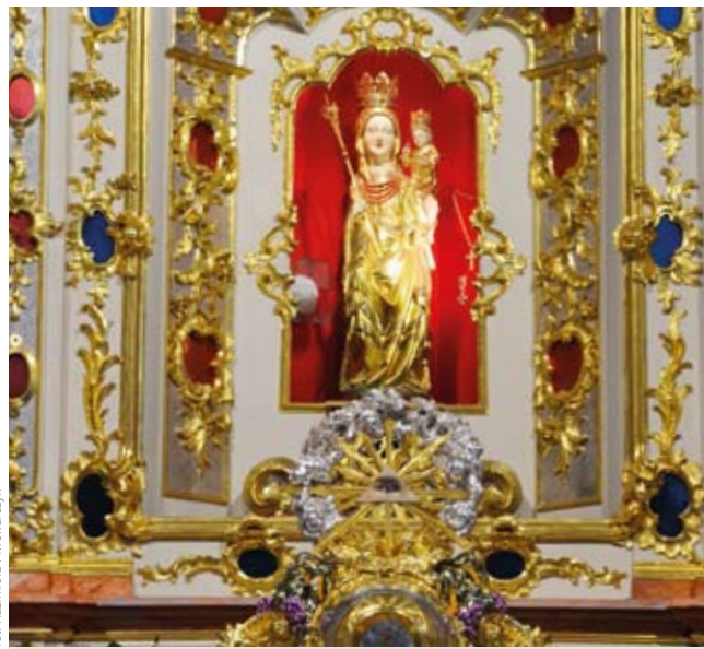
Ołtarz główny w Sanktuarium w Ludźmierzu