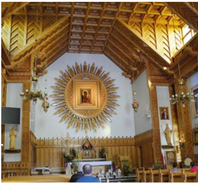
Wnętrze kościoła na Bachledówce