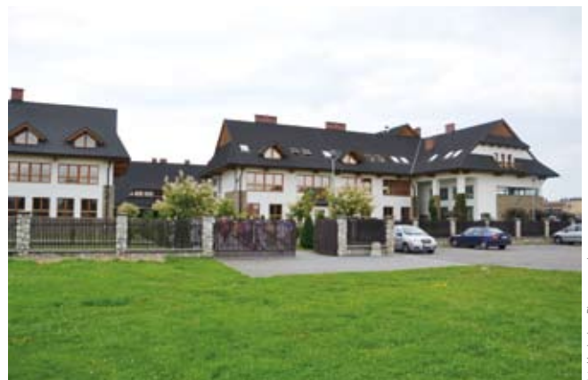
Zespół szkół w Czarnym Dunajcu

żynierów i Techników Budownictwa (CKAIT) – z regionu Ostrava, Czeskiej Izby Autoryzowanych Inżynierów i Techników Budownictwa (CKAIT) i Czeskiego Związku Inżynierów Budowlanych (CSSI) – z regionu Karlove Vary, Słowackiej Izby Inżynierów Budownictwa (SKSI) – z regionu Trnava, Słowackiej Izby Inżynierów Budownictwa (SKSI) i Słowackiego Związku Inżynierów Budownictwa