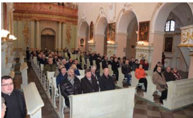
Sesja wyjazdowa do Gościkowa-Paradyża