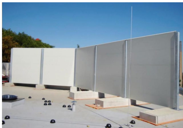
Rys. 2. Mobilna bariera dźwiękowa [6]

W kolejnej pracy zaprezentowanej przez badaczy z Kuwejtu zajęto się tematyką analizy hałasu w odbiorze pracowników budowlanych [7]. Z przeprowadzonych badań wynika, że hałas jest często identyfikowany jako źródło uciążliwości w pracy na budowie. W artykule wskazano, że hałas rośnie wraz ze zmniejszaniem odległości od źródła. Stwierdzono, że większe budowy zwyczajowo generują większy hałas oraz że głośniejsze jest na poziomie terenu niż na wyższych kondygnacjach w tym samym czasie. Te obserwacje można by uznać za dość oczywiste, niemniej biorąc pod uwagę, że pochodzą one