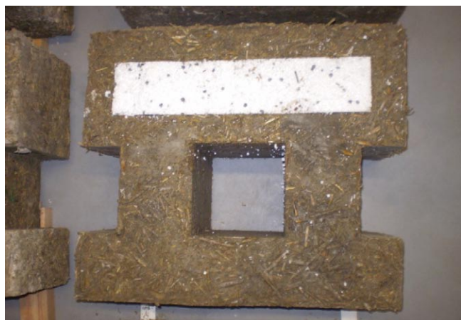
Rys. 2. Wyprodukowany ekologiczny pustak

Pustaki mogą być układane warstwami zarówno na tradycyjnej zaprawie lub na zaprawie do murowania na sucho. Stanowią wypełnienie ustroju szkieletowego, w którym siły wewnętrzne przenoszone są przez słupy drewniane lub żelbetowe. Z ekologicznych pustaków można wznosić przegrody o dobrych parametrach termoizolacyjnych przy zachowaniu zalet ścian jednowarstwowych. Dodatkowym bodźcem do zastosowania zaproponowanych rozwiązań jest to, iż korzystanie z systemów energooszczędnych pozwala w znacznym stopniu zminimalizować emisję zanieczyszczeń oraz wpływa pozytywnie na środowisko naturalne. Przykładowy narożnik ściany wykonany z wytworzonych pustaków z ekologicznym wypełniaczem organicznym przedstawiono na rysunku 3.